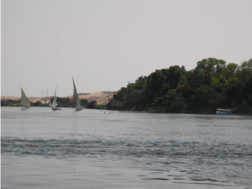
Feluccenfahrt zur Kitchener Island am Programm.