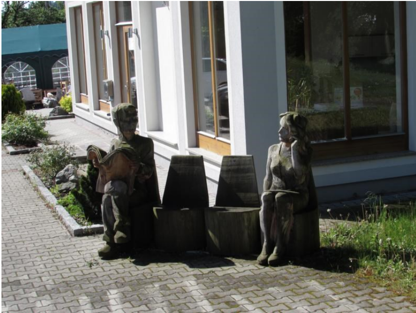
Eine Bank die zum Verweilen einlädt.