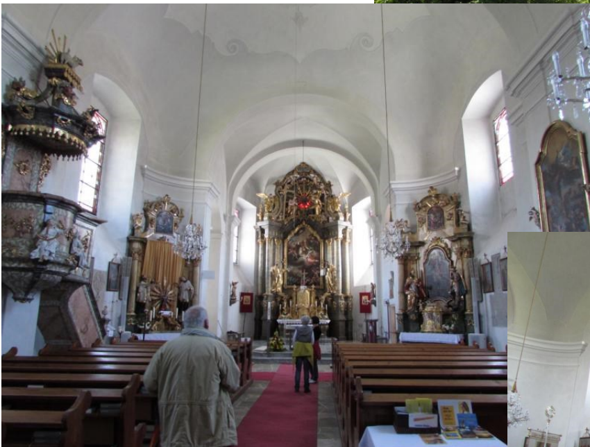
Auch die schlichte Kirche hat es uns angetan.