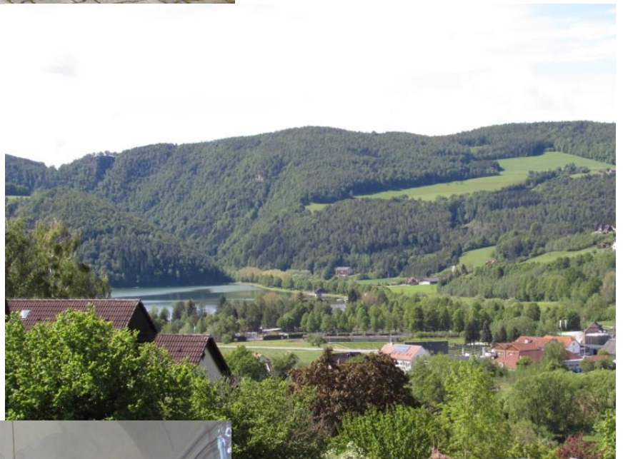
Blick auf den Stubenbergsee.