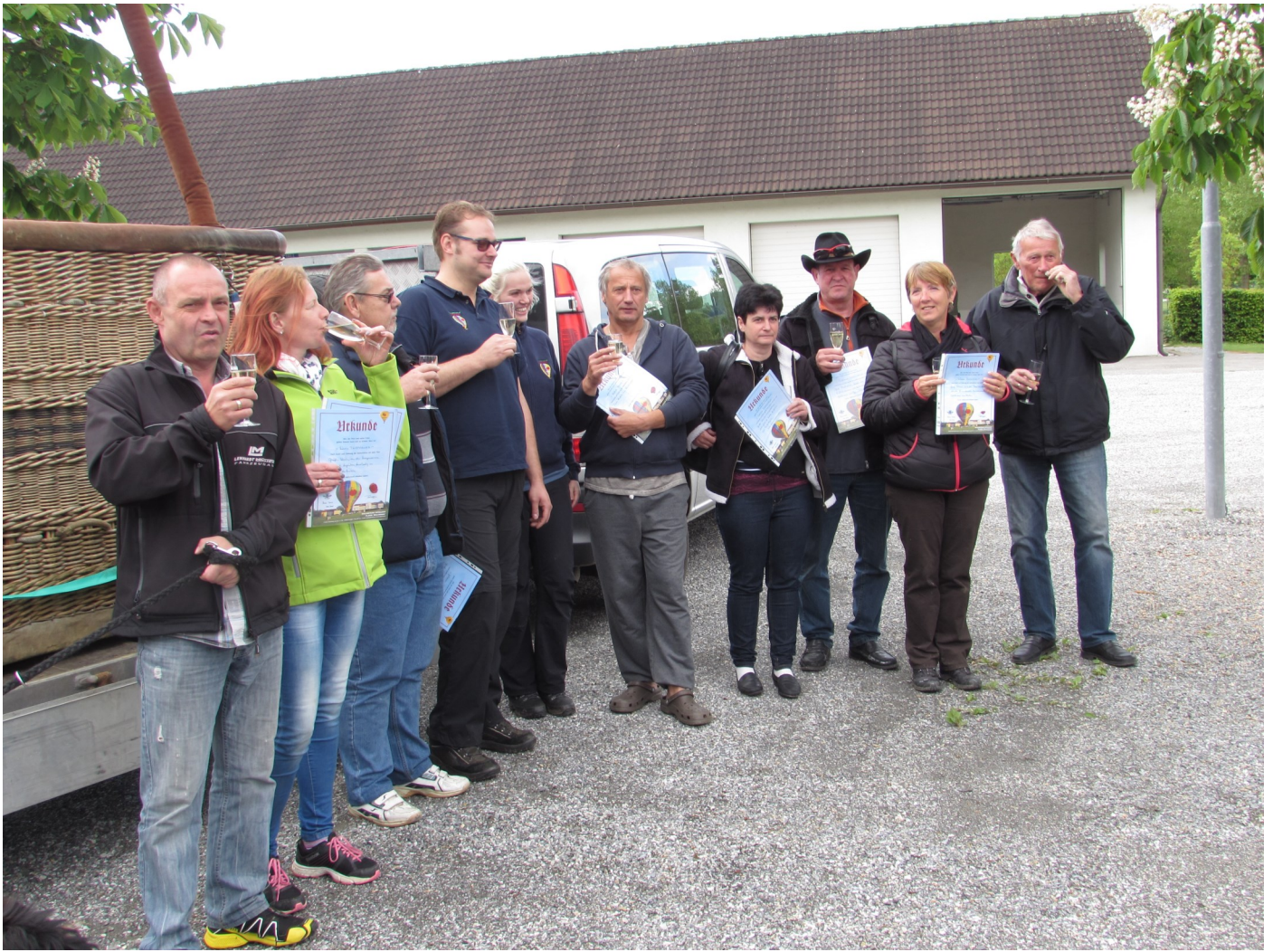
Ein Prosit auf die tapferen Flieger und nochmals Danke für das schöne Treffen am Stubenbergsee.