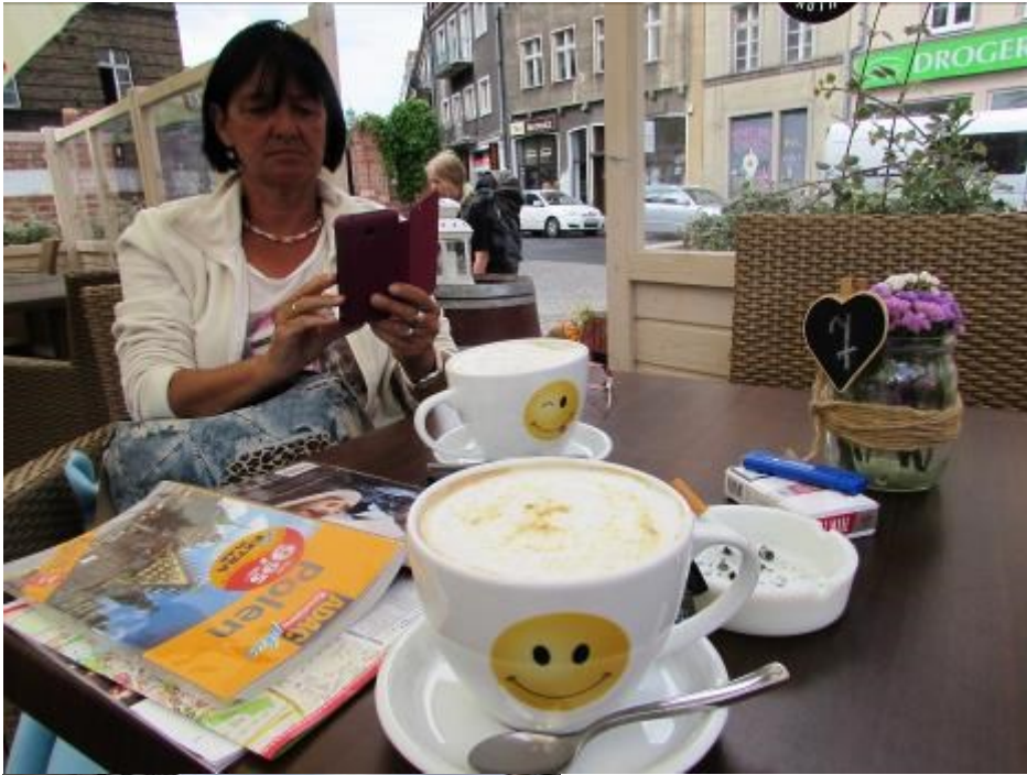
Jetzt erst einmal einen Topf voller Kaffee.