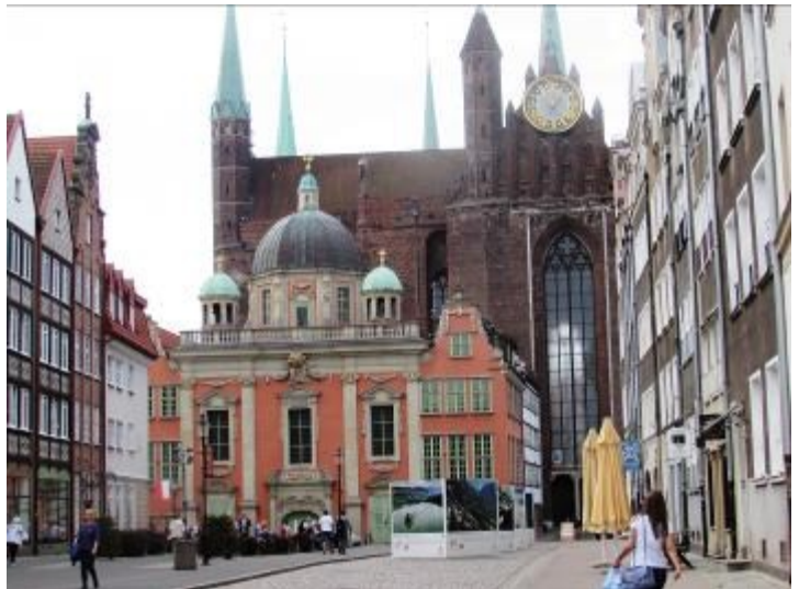
Sehr schöne Bürgerhäuser.