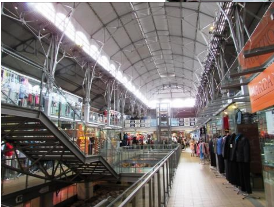
Im Inneren der Markthalle.