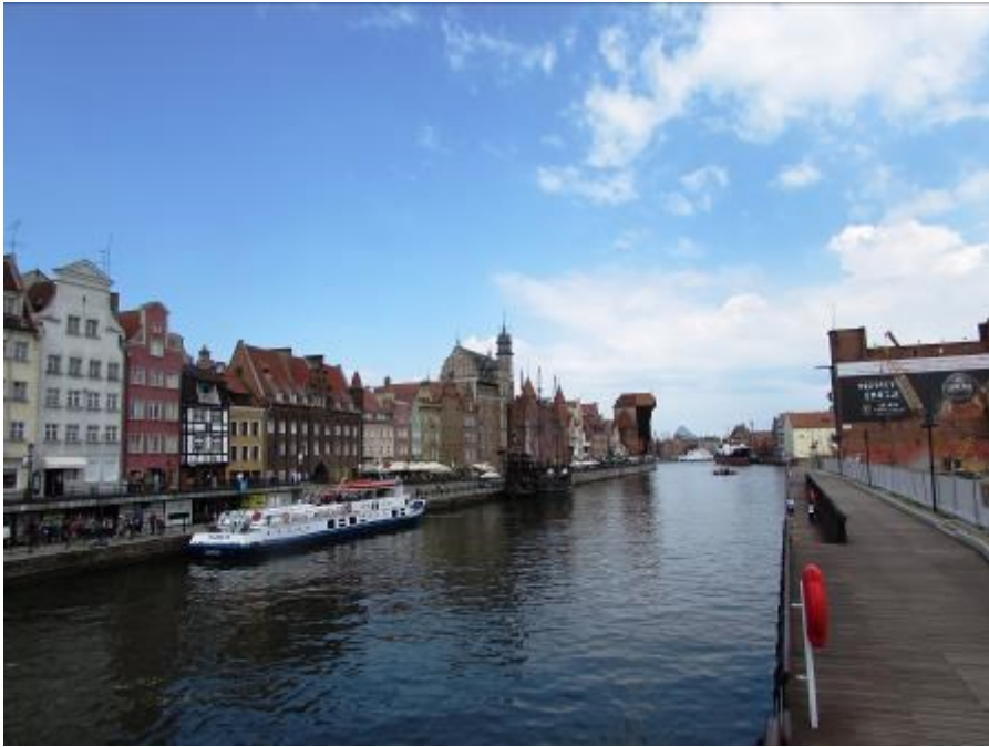
Im Hintergrund das Kran- tor.