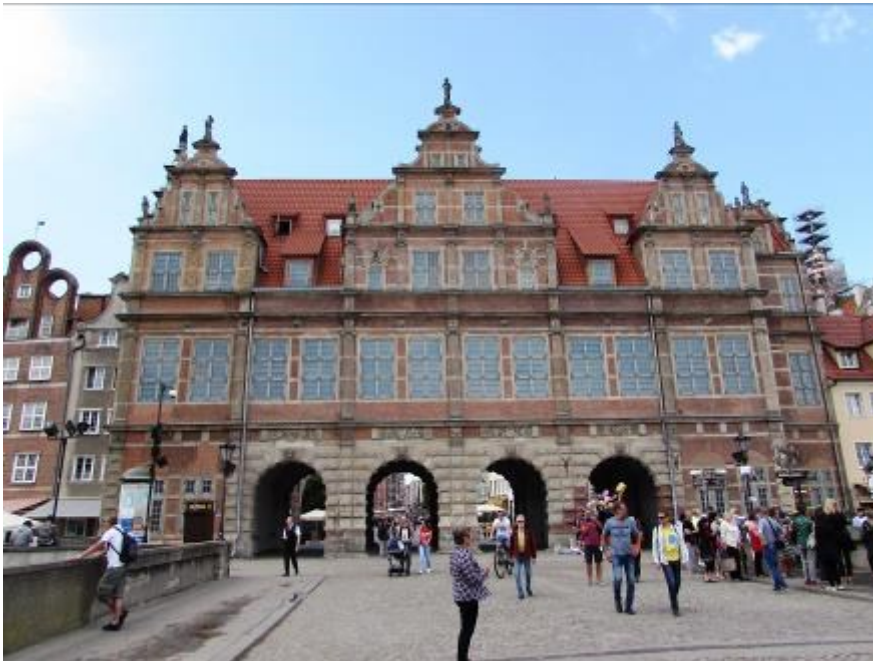
Das grüne Tor.