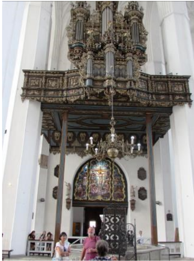
In der Marienkirche.