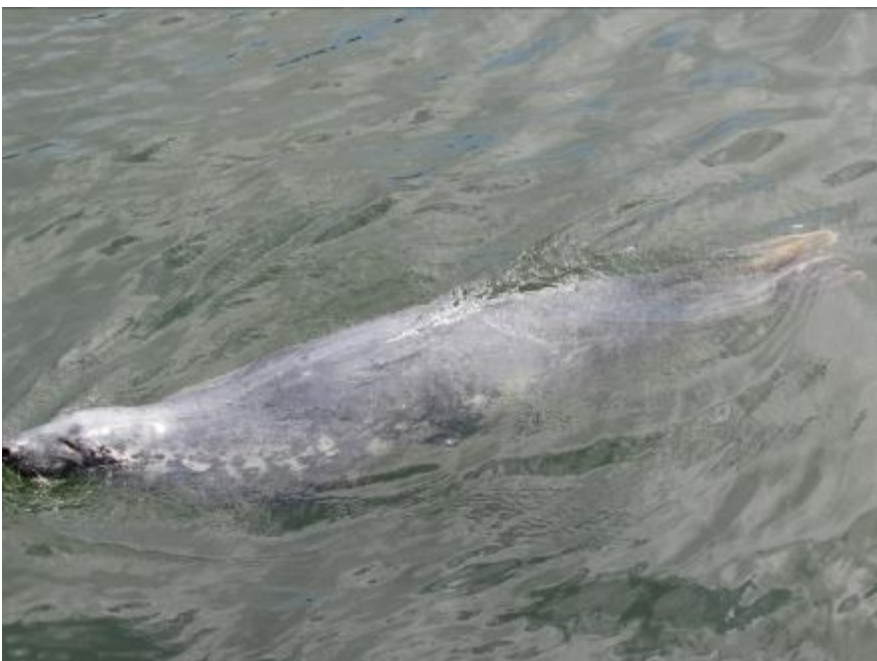
In der Robbenaufzuchtstation.