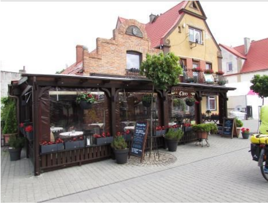
Viele kleine Restaurants am Weg.