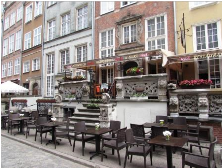
Sehr schöne Fassaden.