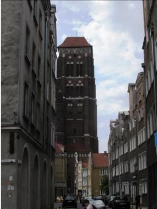
Der Turm der Marienkirche.