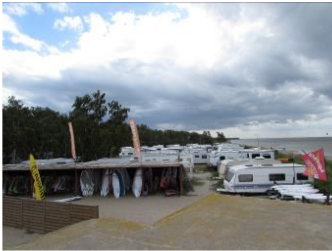
Da hier ein beständiger Wind bläst, sieht man auch jede Menge an Kite-Surfern.