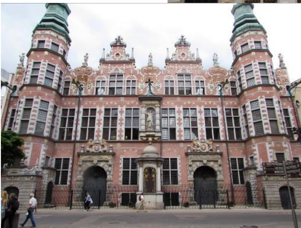
Großes Zeughaus in Danzig. Das Gebäude beherbergte einst als Waffenarsenal Waffen und Kanonen samt Kugeln. Es entstand zwischen 1600 und 1609. Die östliche Frontseite zur Jopengasse zieren zwei Giebel, an die sich zwei Türme an den Seiten anschließen.