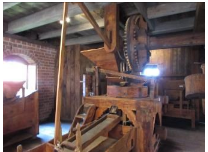
Bei den Rosen und danach gleich wieder in der Landwirtschaft, so schnell geht die Zeitreise vorstatten.