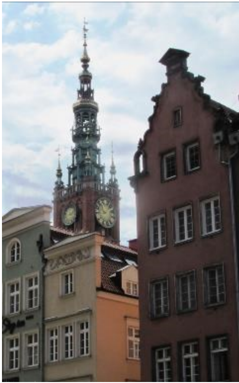
Der Turm des Rechtsstädter Rathaus, mit 80 Metern Höhe.