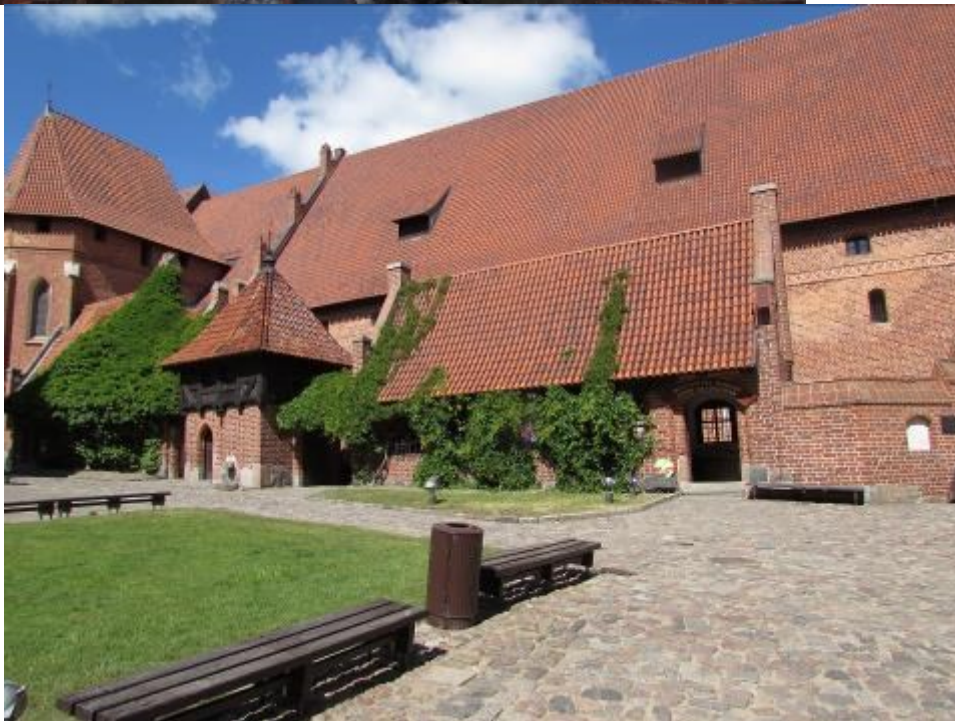
In einem der Innenhöfe der Burg.