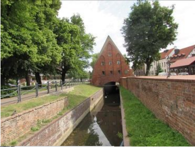
Der Radaunekanal, der damals die Mühlräder angetrieben hat.